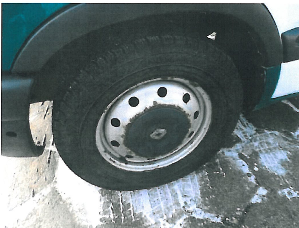
Fot. nr 6. Widok stanu technicznego kół w samochodzie specjalnym Renault Master FD.