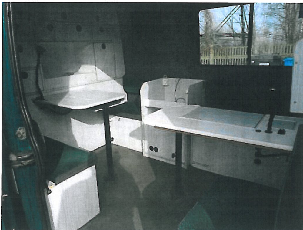
Fot. nr 4. Fragment przedziału zaadaptowanego na biuro dla Inspektorów (zabudowa meblowa).