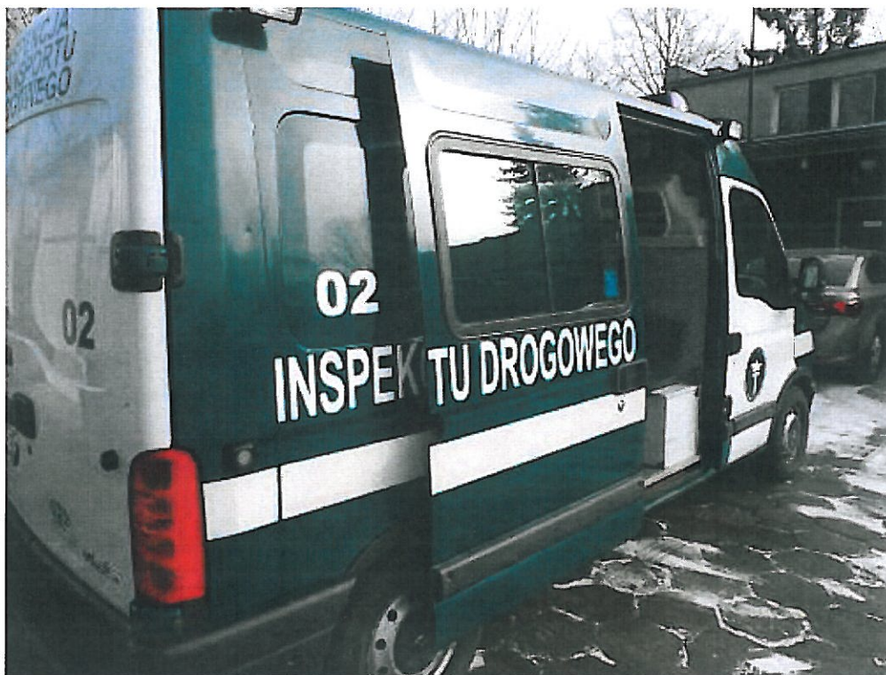
Fot.1 Widok ogólny samochodu specjalnego Renault Master FD z boku.