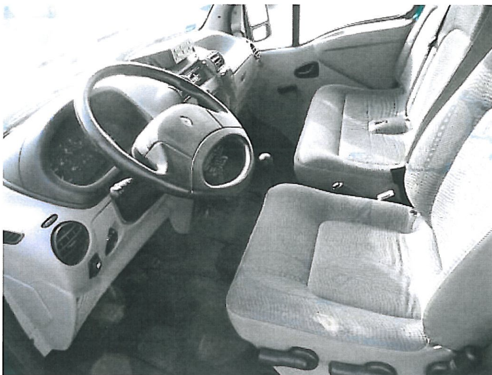
Fot. nr 3. Fragment przedziału osobowego samochodu specjalnego Renault Master FD, tapicerka z miejscowymi przetarciami.