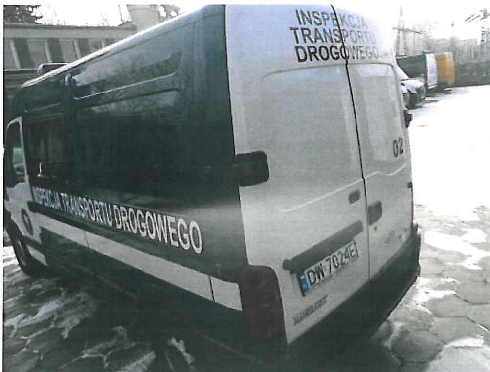
Fot. nr 2. Widok ogólny samochodu specjalnego Renault Master FD z tyłu.