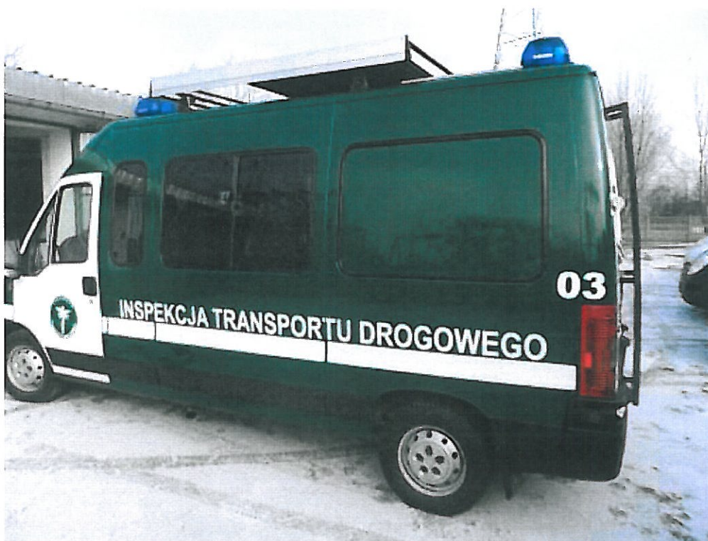
Fot.1 Widok ogólny samochodu specjalnego Fiat Ducato z boku.