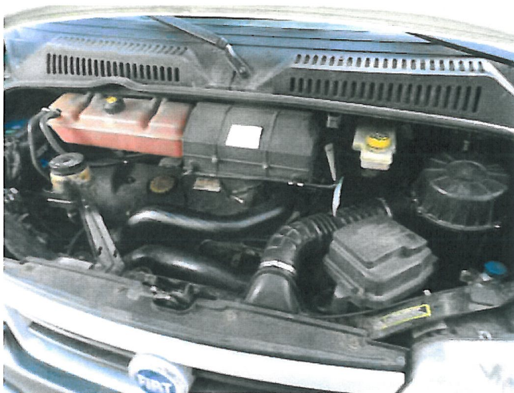
Fot. nr 5. Widok komory silnika samochodu specjalnego Fiat Ducato o nr rejestracyjnym DW 2443M.