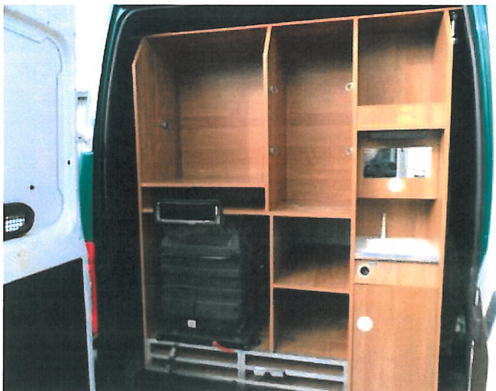
Fot. nr 6. Widok przedziału socjalnego w samochodzie specjalnym Fiat Ducato wraz z agregatem prądowórczym.