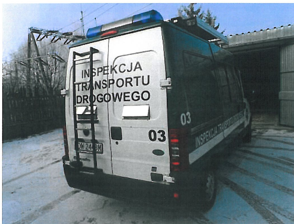
Fot. nr 2. Widok ogólny samochodu specjalnego Fiat Ducato z tyłu.