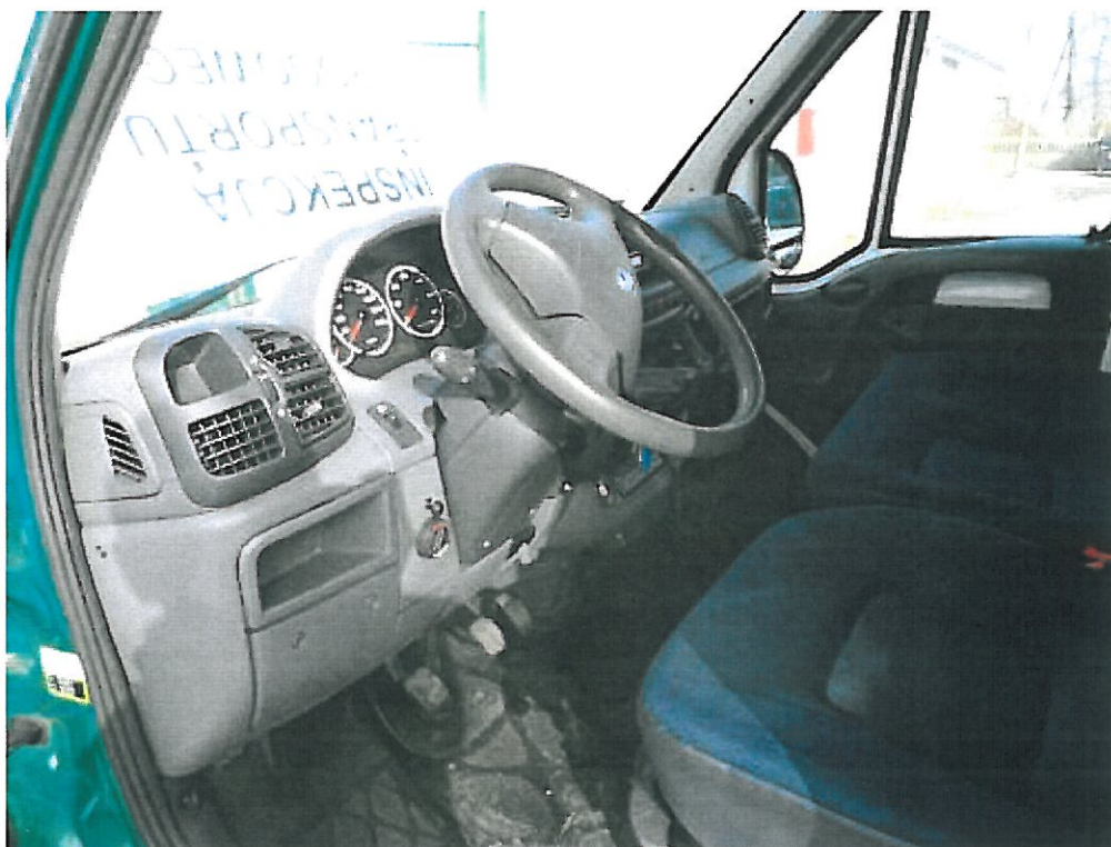
Fot. nr 3. Fragment przedziału osobowego samochodu specjalnego Fiat Ducato.