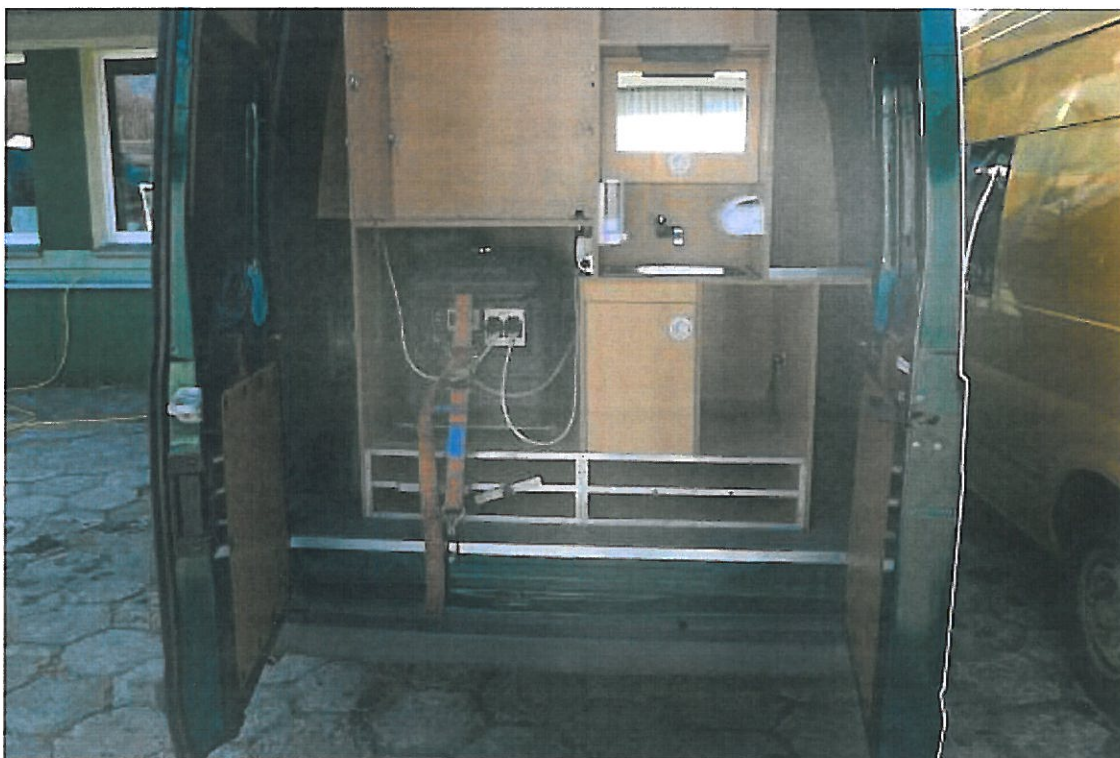
Fot. nr 6. Widok przedziału socjalnego w samochodzie specjalnym Ford Transit wraz z agregatem prądowórczym.