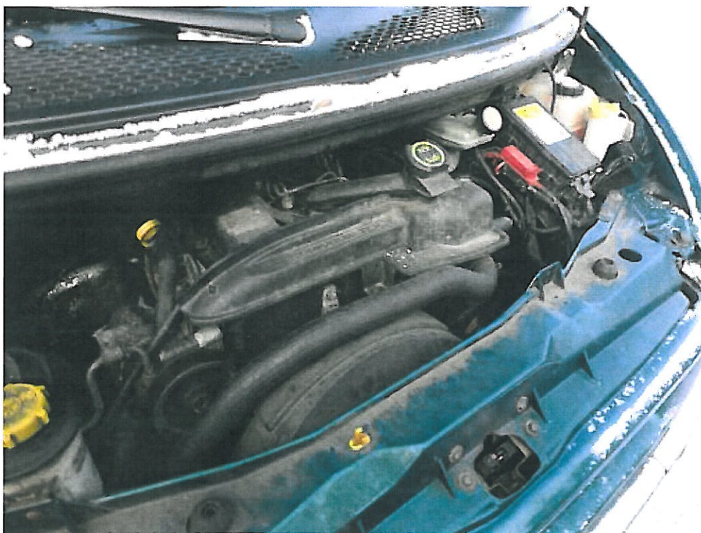
Fot. nr 5. Widok komory silnika samochodu specjalnego Ford Transit o nr rejestracyjnym DW 9715T.