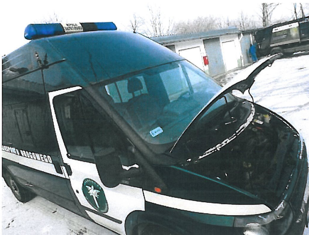
Fot.1 Widok ogólny samochodu specjalnego Ford Transit z boku.