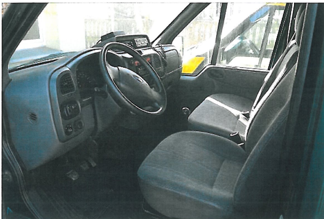
Fot. nr 3. Fragment przedziału osobowego samochodu specjalnego Ford Transit.