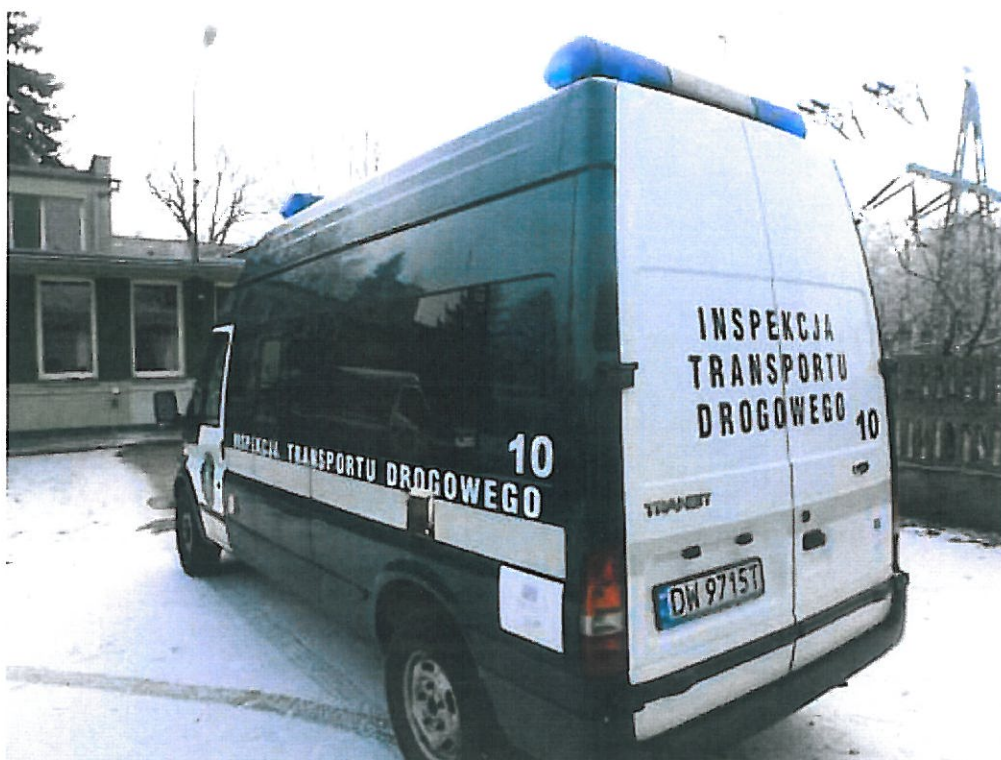
Fot. nr 2. Widok ogólny samochodu specjalnego Ford Transit z tyłu.