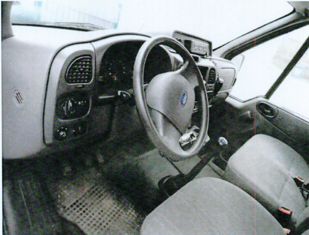
Fot. nr 3. Fragment przedziału osobowego samochodu specjalnego Ford Transit 125 T 300.