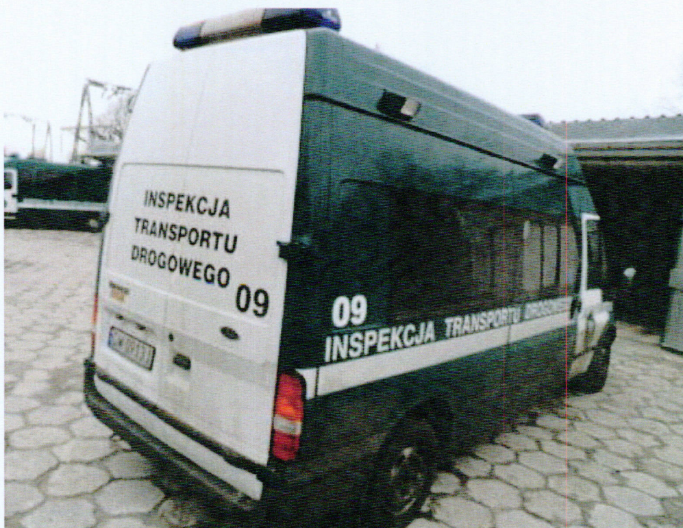
Fot. nr 2. Widok ogólny samochodu specjalnego Ford Transit 125 T 300 z tyłu.