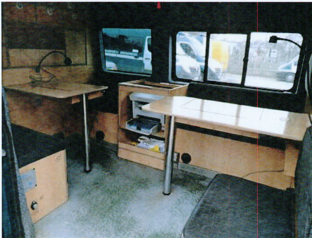
Fot. nr 4. Fragment przedziału zaadaptowanego na biuro dla Inspektorów.