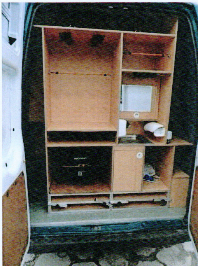
Fot. nr 6. Fragment przedziału bagażowego w samochodzie specjalnym Ford Transit 125 T 300.