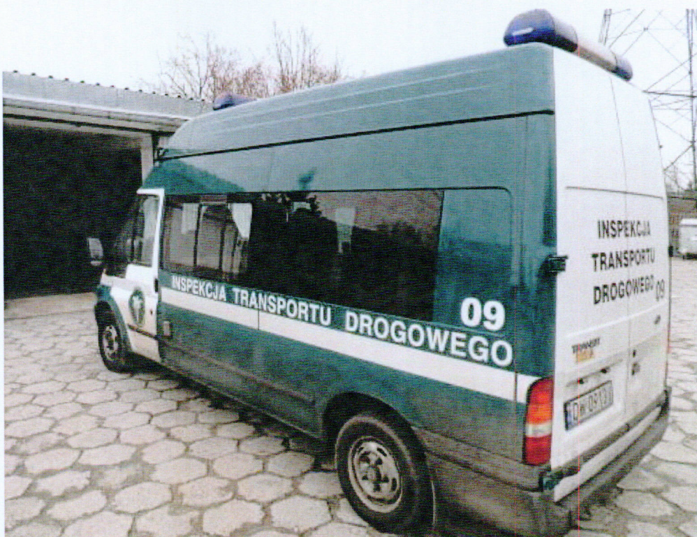
Fot.1 Widok ogólny samochodu specjalnego Ford Transit 125 T 300 z boku.