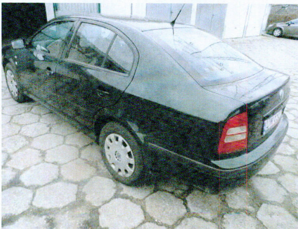
Fot.1 Widok z boku samochodu osobowego Skoda Octavia.