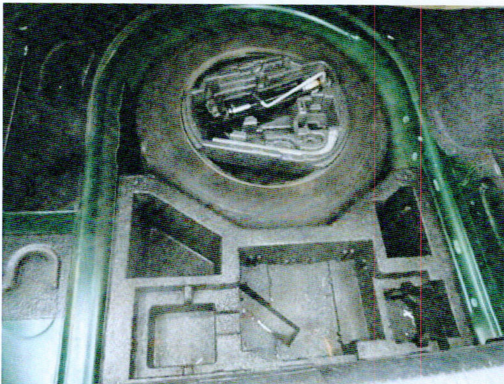
Fot. nr 6. Wyposażenie komory bagażnika samochodu osobowego Skoda Octavia o nr rejestracyjnym DW 6581M.