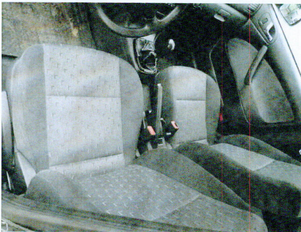
Fot. nr 3. Fragment przedziału osobowego samochodu Skoda Octavia.