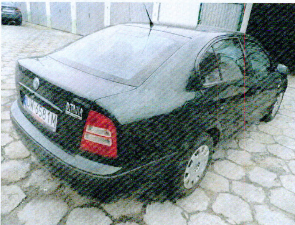
Fot.2 Widok prawego boku samochodu osobowego Skoda Octavia.