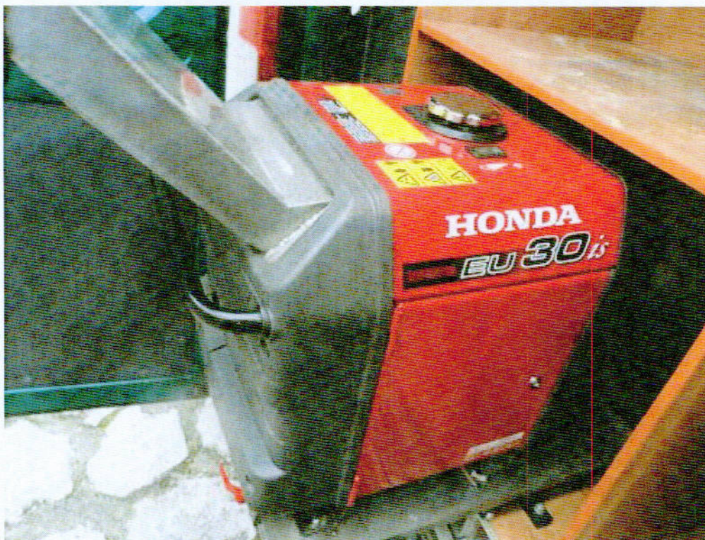
Fot. nr 7. Widok szczegółowy agregatu prądotwórczego będącego na wyposażeniu samochodu specjalnego Fiat Ducato.