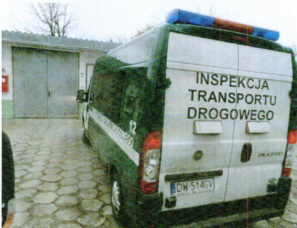
Fot. nr 2. Widok ogólny samochodu specjalnego Fiat Ducato z tyłu.