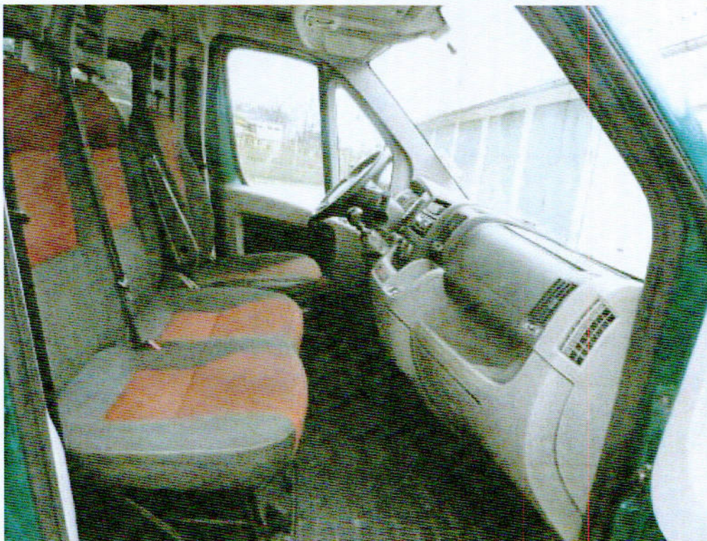
Fot. nr 3. Fragment przedziału osobowego samochodu specjalnego Fiat Ducato.