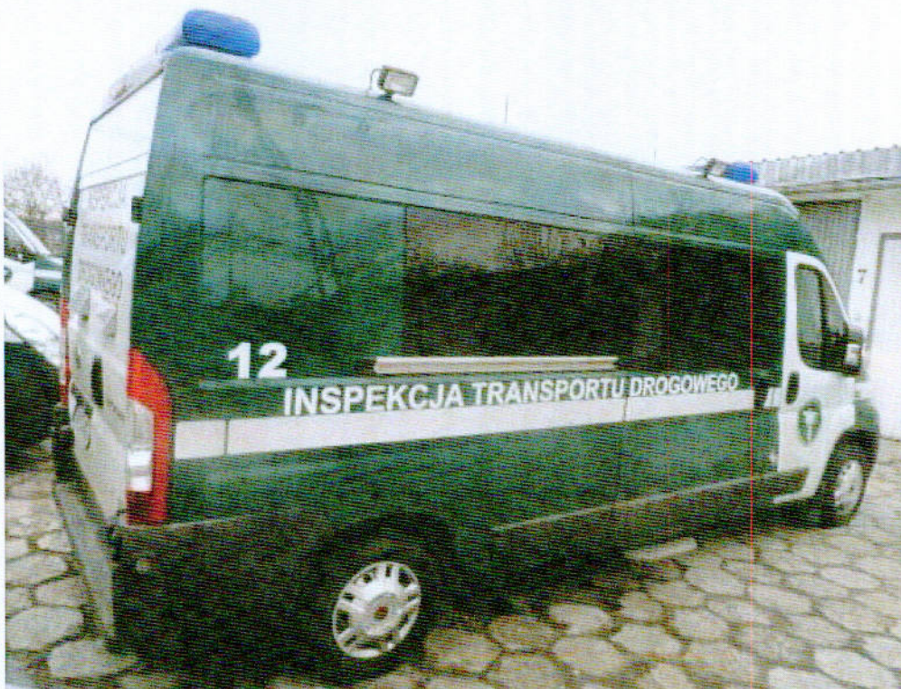
Fot.1 Widok samochodu specjalnego Fiat Ducato DW 514GV z prawej strony.