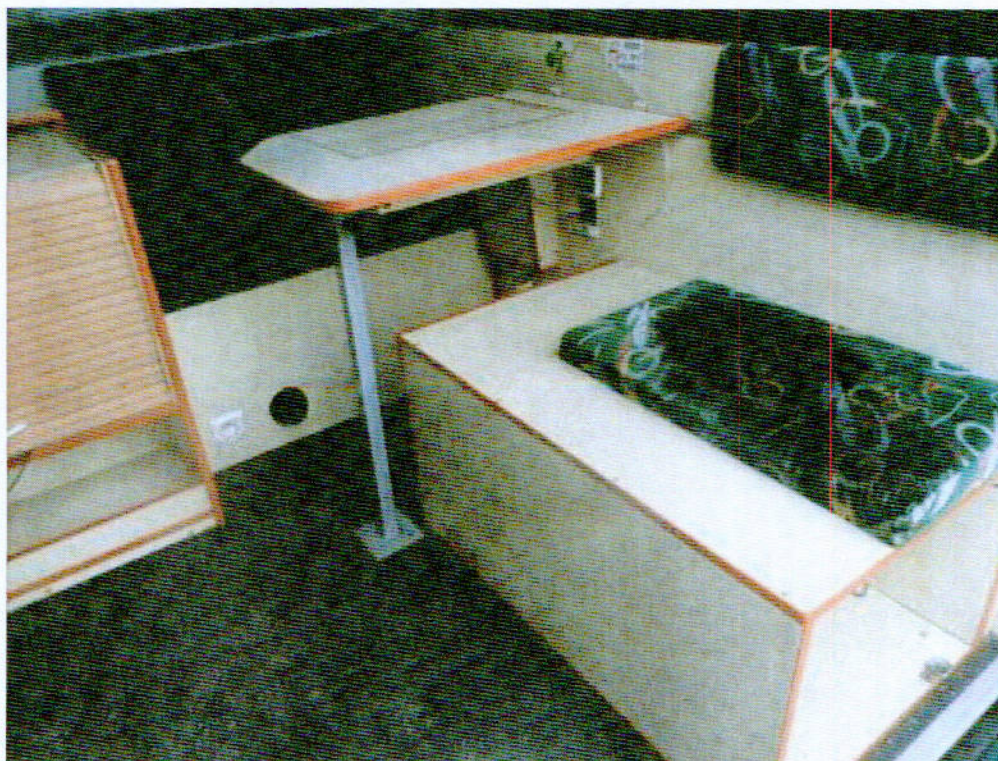
Fot. nr 4. Widok zabudowy meblowej przedziału zaadaptowanego na biuro dla Inspektorów.