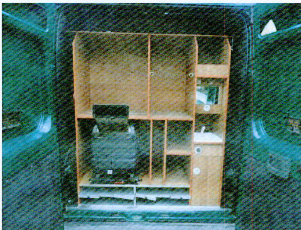
Fot. nr 6. Widok przedziału socjalnego w samochodzie specjalnym Fiat Ducato wraz z agregatem prądowórczym.