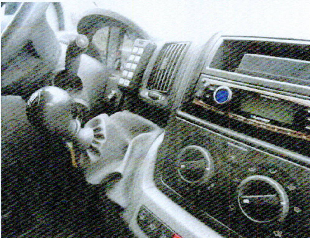
Fot. nr 3. Fragment wnętrza przedziału osobowego samochodu specjalnego Fiat Ducato.