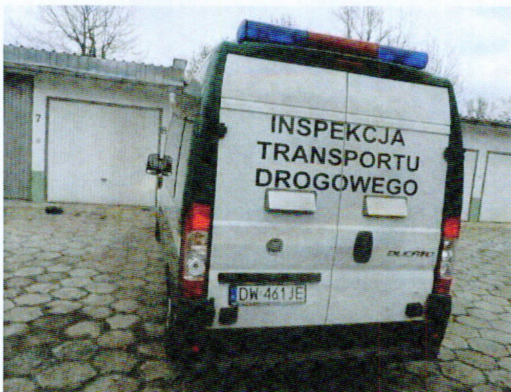
Fot.2 Widok ogólny samochodu specjalnego Fiat Ducato z tyłu.