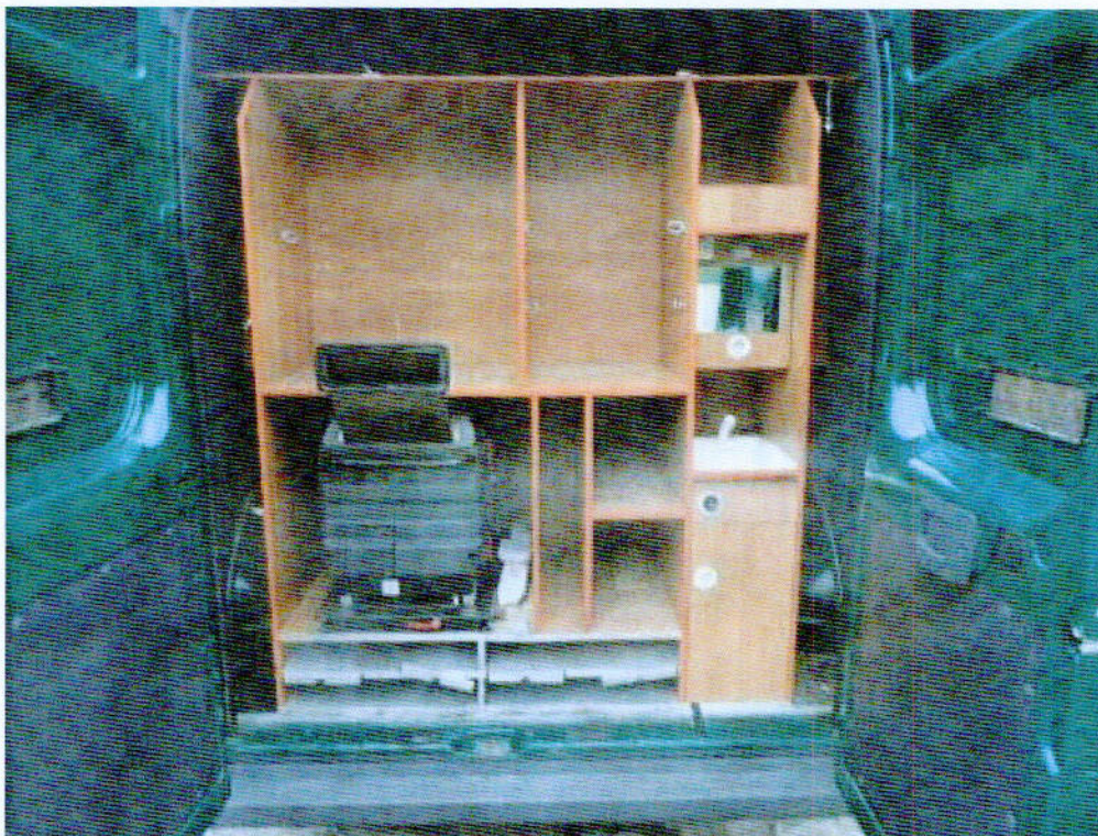
Fot. nr 6. Widok przedziału zabezpieczenia socjalnego w samochodzie specjalnym Fiat Ducato wraz z agregatem prądowórczym.