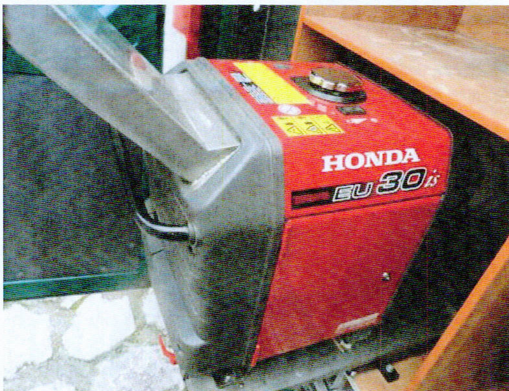
Fot. nr 7. Widok szczegółowy agregatu prądotwórczego będącego na wyposażeniu samochodu specjalnego Fiat Ducato.