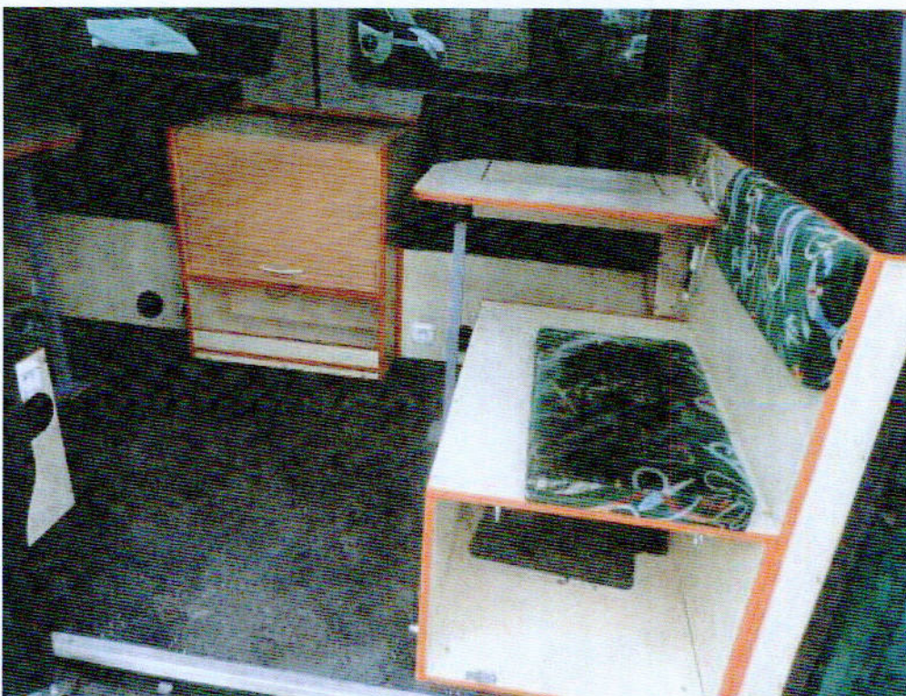
Fot. nr 4. Widok zabudowy meblowej przedziału zaadaptowanego na biuro dla Inspektorów.