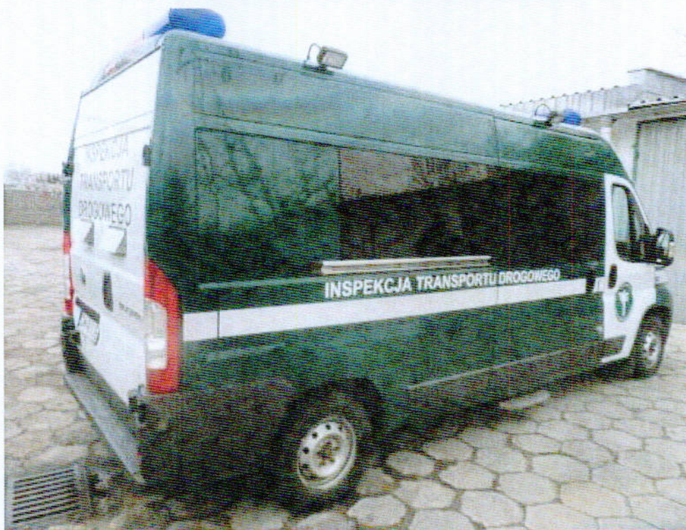
Fot.1 Widok ogólny samochodu specjalnego Fiat Ducato DW 461JE z boku.