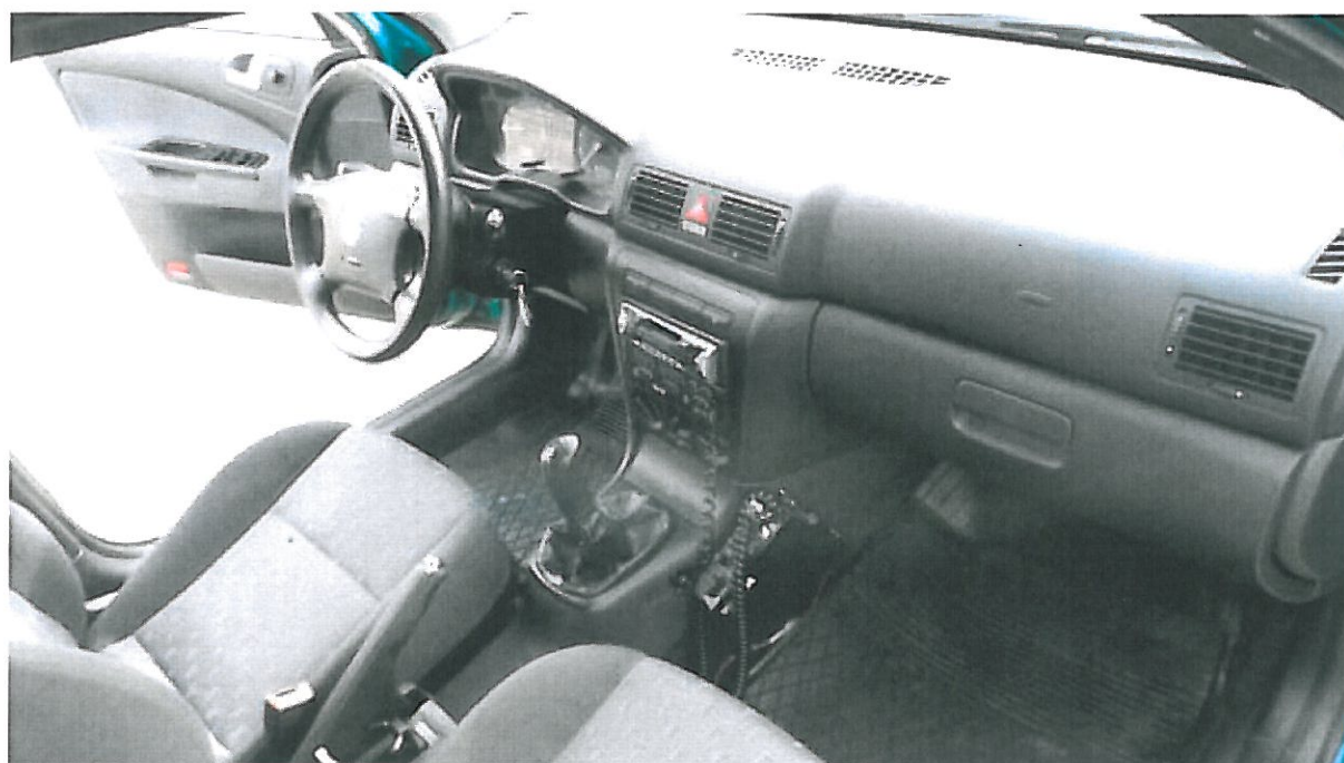
Fot. nr 2. Fragment przedziału osobowego samochodu specjalnego Skoda Octavia.