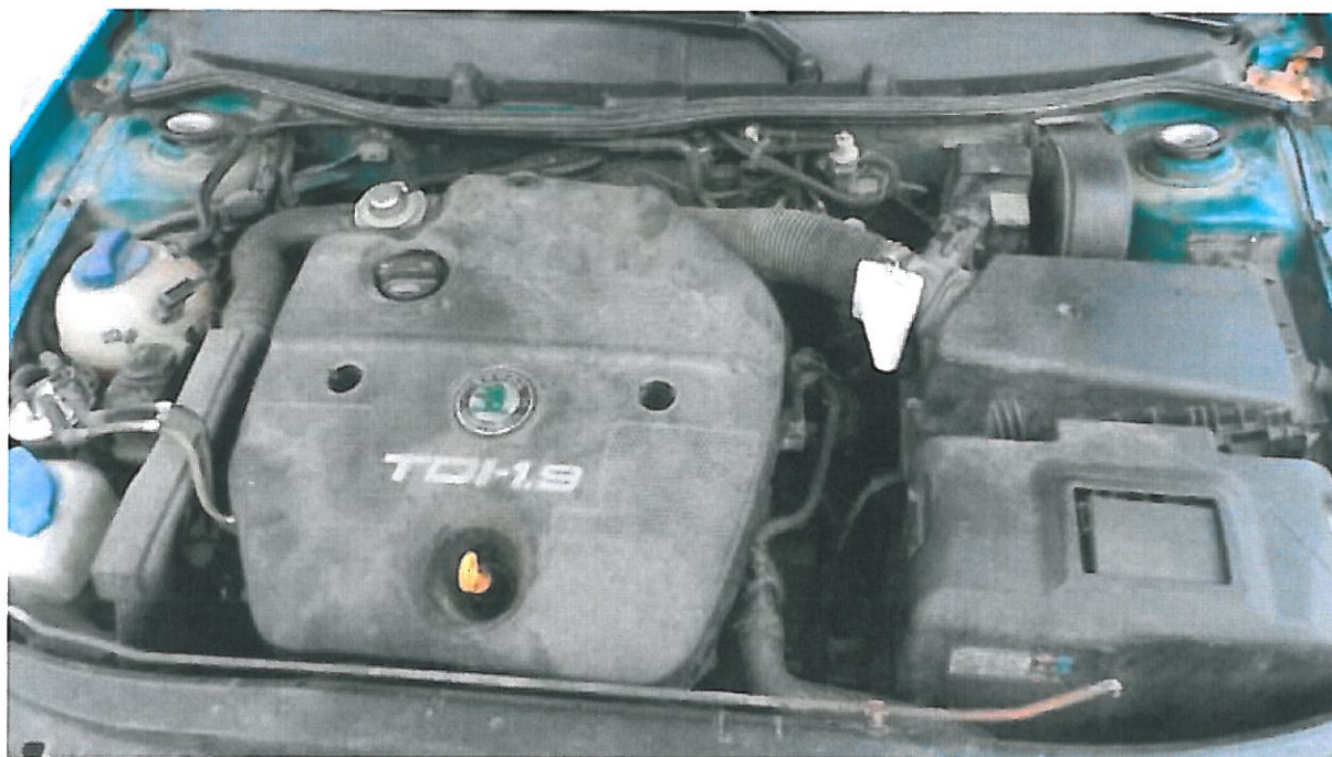
Fot. nr 4. Widok komory silnika samochodu specjalnego Skoda Octavia o nr rejestracyjnym DW 8349F.