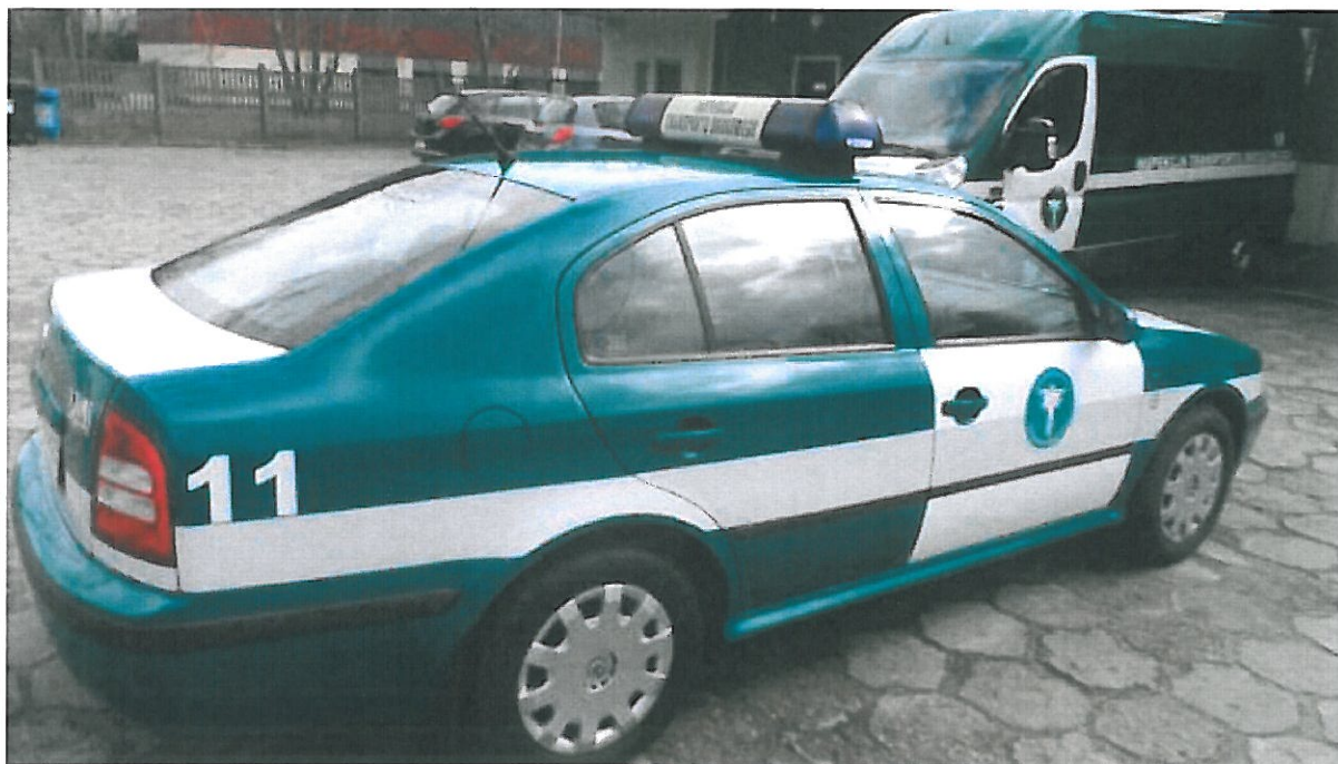
Fot.1 Widok ogólny samochodu specjalnego Skoda Octavia z boku.