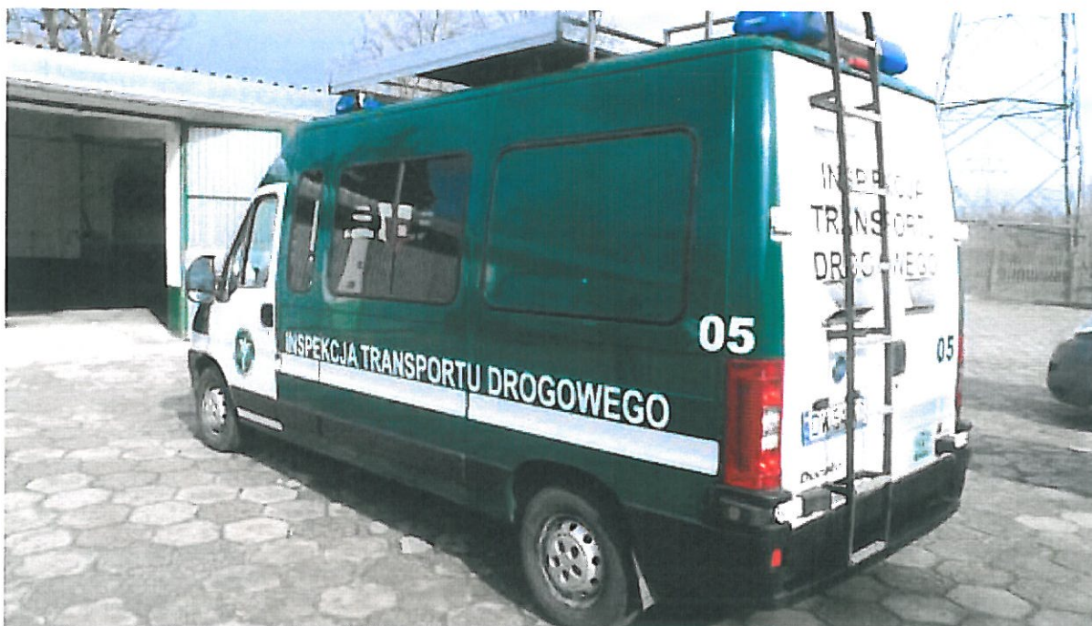
Fot.1 Widok ogólny samochodu specjalnego Fiat Ducato z boku.