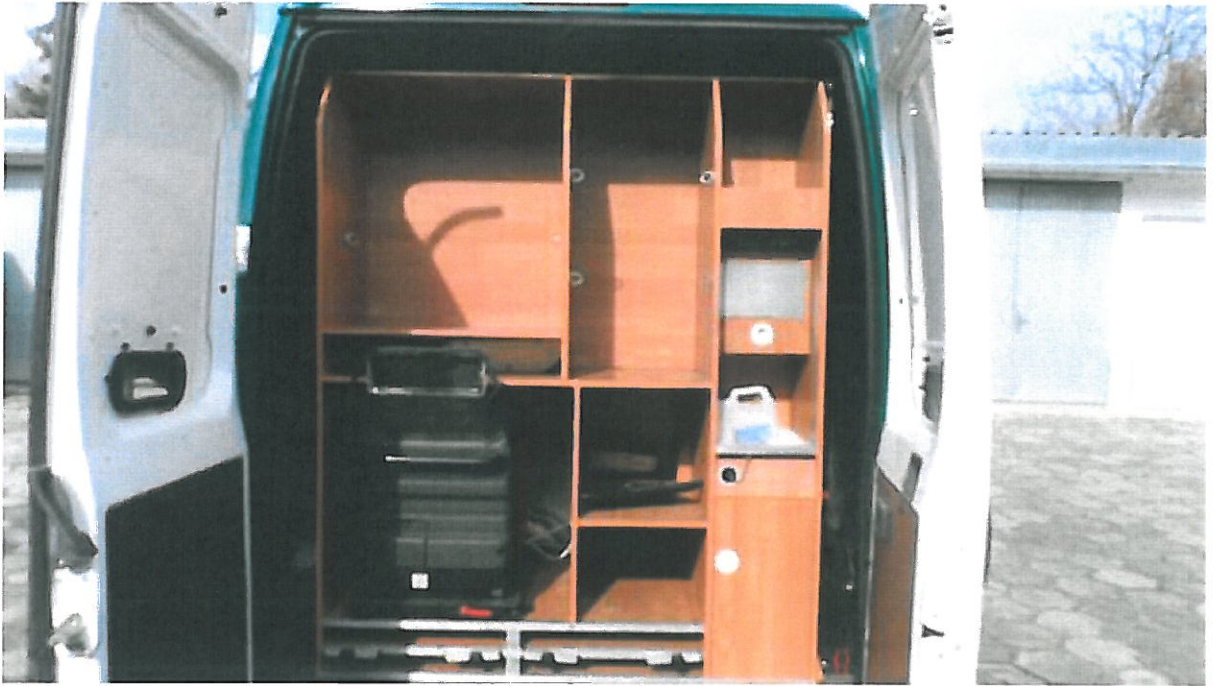
Fot. nr 5. Widok przedziału socjalnego w samochodzie specjalnym Fiat Ducato wraz z agregatem prądowórczym.