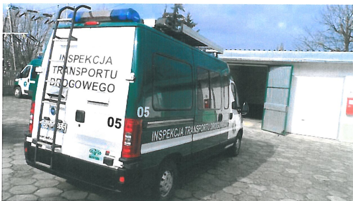
Fot. nr 2. Widok ogólny samochodu specjalnego Fiat Ducato z tyłu.