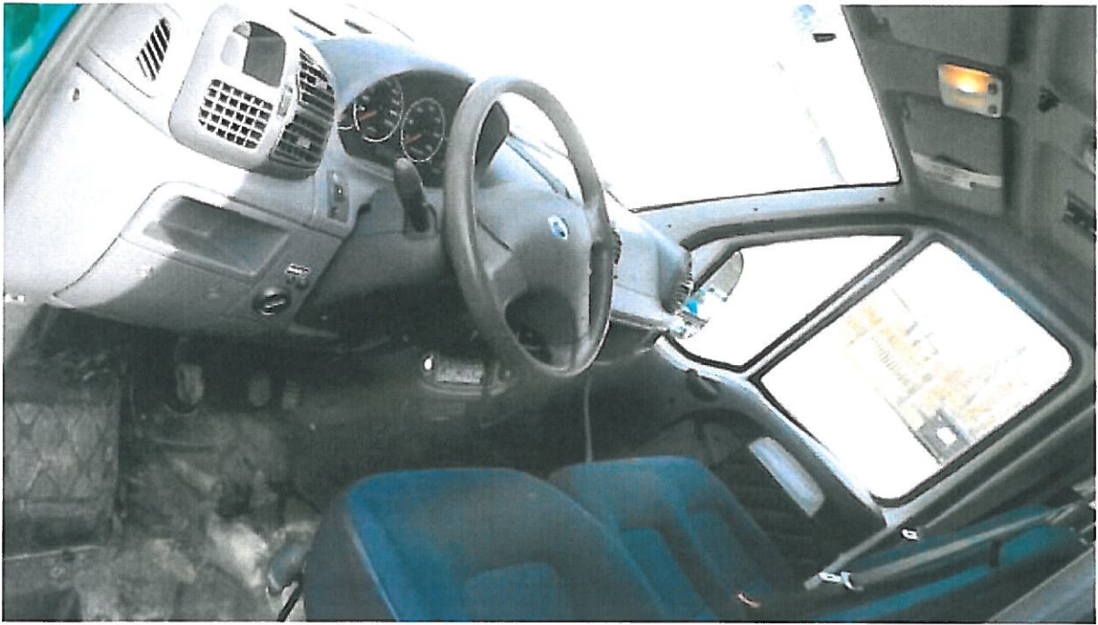
Fot. nr 3. Fragment przedziału osobowego samochodu specjalnego Fiat Ducato.